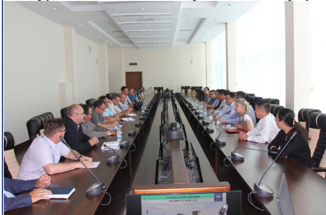
Переговоры белорусский атомщиков с китайскими коллегами

Целью визита являлось обсуждение возможных направлений сотрудничества. Делегация города Шанхай посетила Белорусскую АЭС. Китайская делегация во главе с заместителем начальника Комитета экономики и информатизации г. Шанхай Вэй Пином ознакомилась с экспозицией информационного центра Белорусской АЭС, совершила обзорную