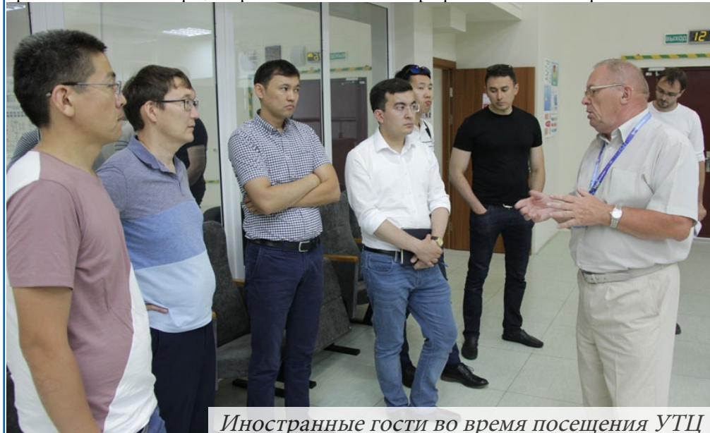
Иностранные гости во время посещения УТЦ

Участники визита ознакомились с ходом работ по сооружению АЭС; системой подготовки персонала в учебно-тренировочном центре; организацией информационной работы на