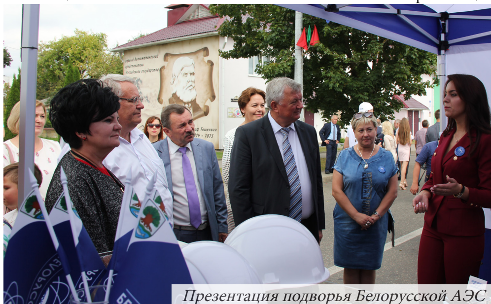
Презентация подворья Белорусской АЭС

В рамках торжества государственное предприятие «Белорусская АЭС» провела свою презентацию. Экспозиция размещалась в самом центре города и отличалась информационной насыщенностью, актуальностью представленных материалов и эстетичной привлекательностью. Не случайно, среди жителей и гостей города-юбиляра экспозиция атомной электростанции