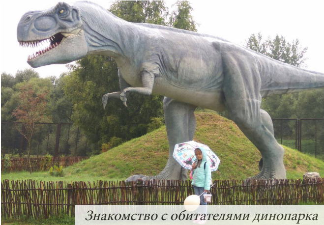
Знакомство с обитателями динопарка

Как на любом хорошем празднике, тут было уйма развлечений: детские тематические