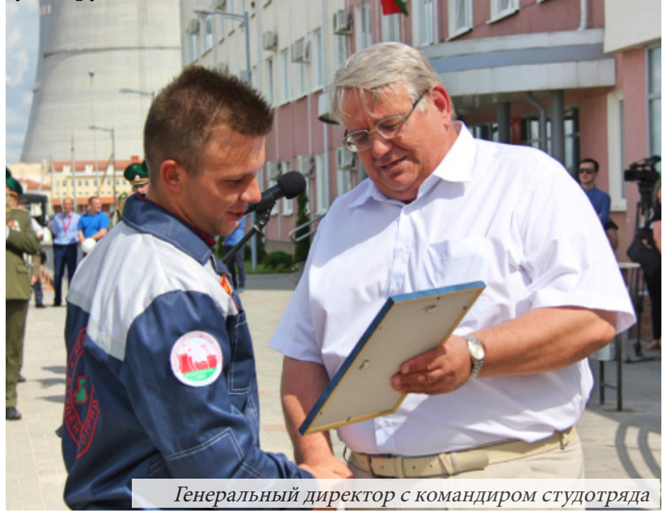
Генеральный директор с командиром студотряда

Первый энергоблок — в стадии завершения общестроительных работ и перехода к активной фазе монтажа. На отдельных объектах и системах приступили к выполнению пусконаладочных работ. На 2-ом энергоблоке выполняются общестроительные, а также тепло- и электромонтажные работы. В целом стройка в полном объеме обеспечена необходимым количеством материалов и сырья для бесперебойного выполнения поставленных задач.