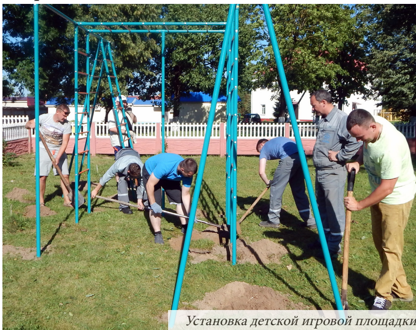
Установка детской игровой площадки

Поэтому у нас и возникла идея создания своей «резервной комнаты», которую необходимо оборудовать всем необходимым для самых маленьких воспитанников. Для реализации всех этих планов нам необходима помощь».