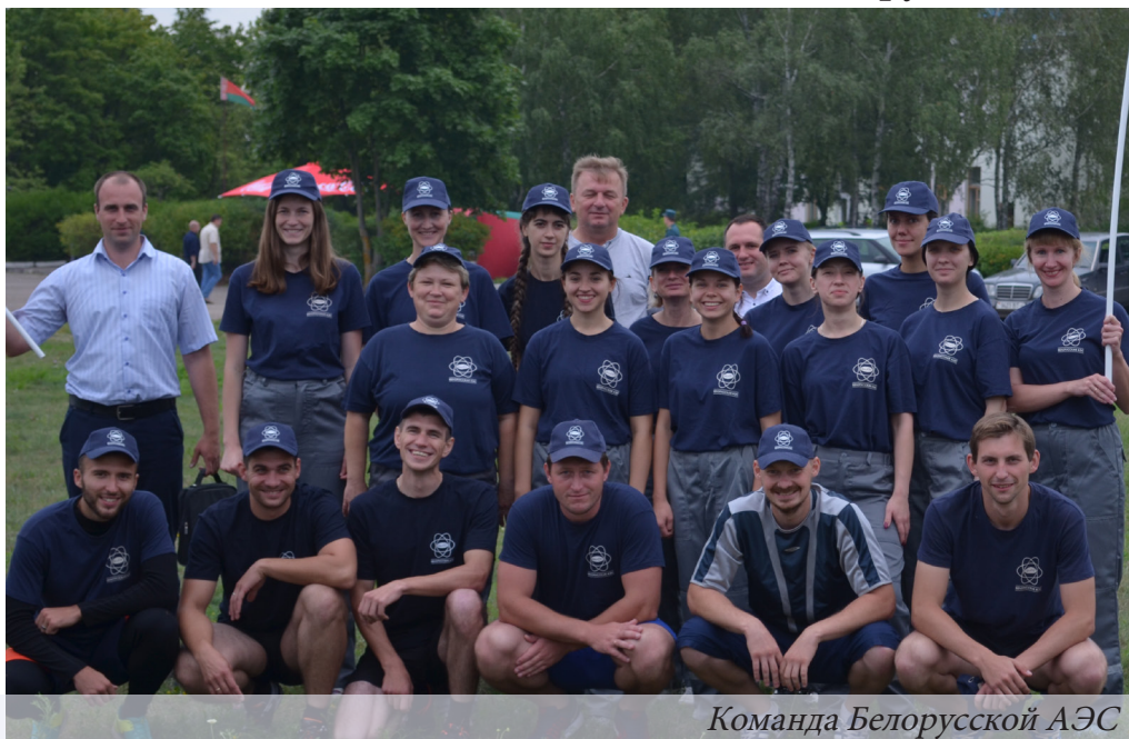
Команда Белорусской АЭС

В Гродно прошли соревнования на лучшую добровольную пожарную дружину области. Среди 16 заявленных коллективов Островецкий район был представлен победителем регионального первенства – командой Белорусской АЭС