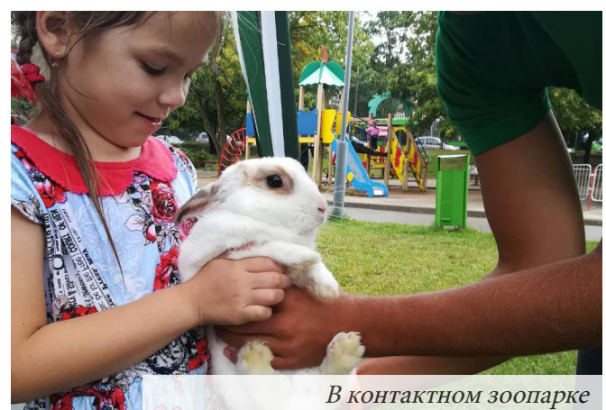
В контактном зоопарке

или кустом ожидали доисторические монстры, приветствующие своих зрителей покачиваниями головы, лап, хвоста, и громким рыком. Особенно всех впечатлил теранозавр Рекс, возвышающийся над посетителями на много метров. Венцом программы стала встреча с дружелюбными и удивительно умными обитателями морей – дельфинами и морскими котиками. Высокие прыжки, песни и, конечно же, множество брызг зарядили весельем и радостью не только детей, но и взрослых. Надеемся, что традиция проводить