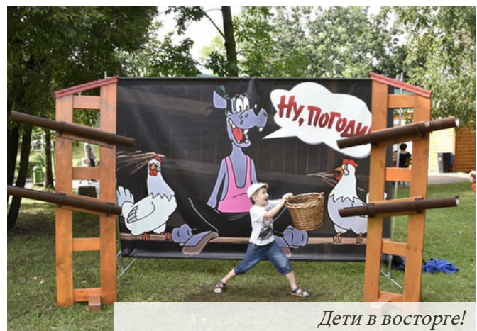
Дети в восторге!

Чтобы морально поддержать «тружеников парты и тетради» профсоюзный комитет государственного предприятия «Белорусской АЭС» организовал поездку для первоклассников и их родителей в динопарк, экзотериум, террариум,